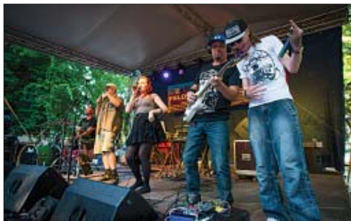
Nagy siker volt a Balkan Fanatik koncertje