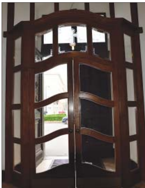
A Horváth Mihály téri templom lengőkapuja

– Tisztességesen, rendezesen, lelkiismeretesen, szakmailag és esztétikailag igényesen kell dolgozni. Ez egyébként az egyik jelszavunk a józsefvárosi plébániához tartozó Kolping családközösségben is, amelynek a világi elnöke vagyok. Azonkívül szeretni kell a szakmát, és persze betartani a határidőket. Akkor az embert tovább ajánlják, és meg lehet maradni a piacon.