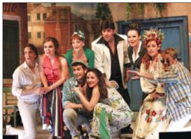
Jelenet az Anconai szerelmesek című darabból