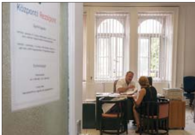
Tanácsadás rezsiiügyekben a József krt. 6-ban

A június elsején nyitott rezsipontban tájékoztatást kaphatunk a jogszabályi előírásokról, a fogyasztók által kezdeményezhető eljárásokról, valamint az igénybe vehető érdekérvényesítési eszközökről. Amennyiben értelmezhetetlen egy