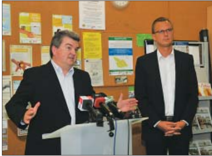
Czibere Károly államtitkár és Rétvári Bence miniszterhelyettes

Az Emberi Erőforrások Minisztériuma a leginkább rászorulókat segítése érdekében indít programot, több mint 29 milliárd forint értékben. A Rászoruló Személyeket Támogató Operatív Program (RSZTOP) a megfelelő étkezés és az alapvető fogyasztási cikkek hiányát kívánja enyhíteni, kiegészülve a szegénység csökkentését szolgáló intézkedésekkel. A programot Rétvári Bence miniszterhelyettes és Czibere Károly államtitkár ismertette a józsefvárosi Kesztyűgyárban.