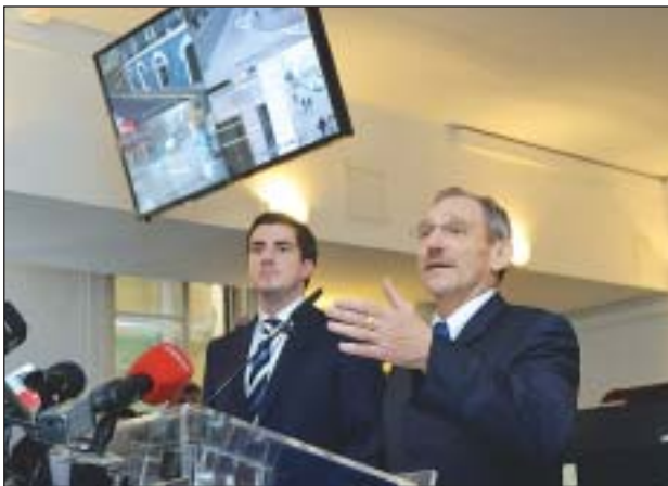
Kocsis Máté polgármester és Pintér Sándor belügyminiszter adta át a felújított térfigyelő központot

A VIII. kerületi rendőrkapitányság épületében Pintér Sándor belügyminiszter és Kocsis Máté polgármester adta át a felújított térfigyelő központot, amely 180 új kamera segítségével szinte az egész kerületet lefedi.