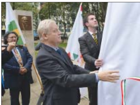
Tarlós István és Kocsis Máté leplezi id. Kathy-Horváth Lajos és Berki Béla emléktábláját

Idősebb Kathy-Horváth Lajos és Berki Béla domborműve is felkerült a Muzsikus Cigányok Parkjának tablóira. Az új emléktáblákat Tarlós István főpolgármester és Kocsis Máté, Józsefváros polgármestere a két művész családjának jelenlétében leplezte le.