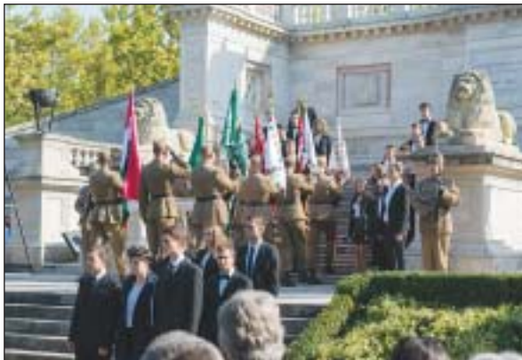
Megemlékezés a Batthyány-mauzóleumnál

Józsefváros vezetése október 6-án a Fiumei úti Sírkertben álló Kossuth-mauzóleumnál emlékezett meg a tizenhárom aradi vértanúról. Ezt követően a Batthyány-mauzóleumnál tartott központi emlékünnepeken Hende Csaba honvédelmi miniszter beszédében felidézte, hogy mit hagytak ránk az aradi vértanúk és Batthyány Lajos, az első független felelős magyar kormány kivégzett miniszterelnöke.