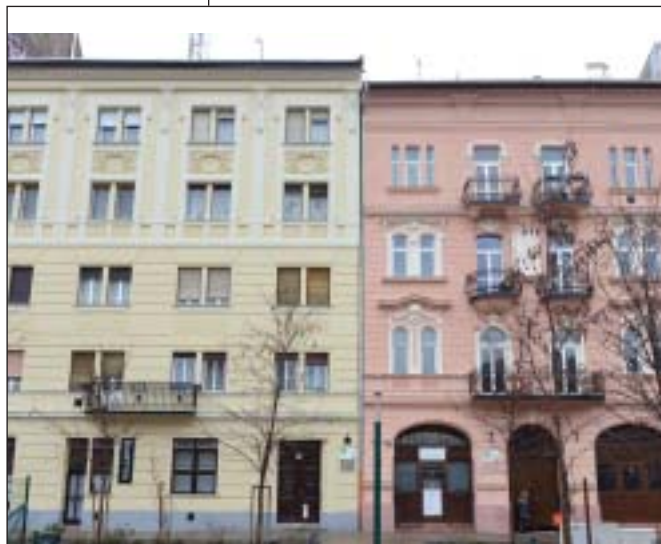
A kerületi építményadó összege 2011 óta nem emelkedett

ban élnek, nem használják, nincs itt lakcímmük, tehát úgy is mondhatjuk, hogy a nem életvitelszerűen használt lakások után kell adózni. Az adó mértéke évi 28.140 forint lesz, a befolyt összegből a társasházak felújítását fogjuk támogatni.” A végső döntést a képviselő-testület hozza meg.