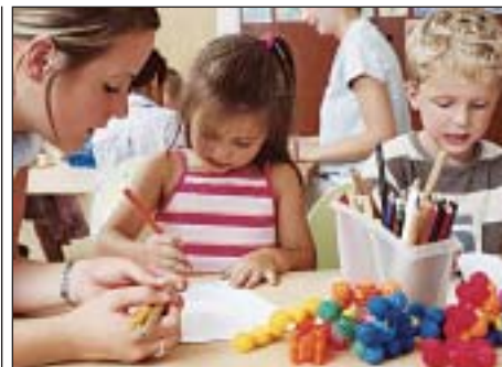
Jövő szeptembertől 3 éves kortól kötelező lesz az óvoda

A minőségi oktatás a gyermekek és az ország jövőjének alapja. 2015-ben a köznevelés további megújítása is fontos feladat.