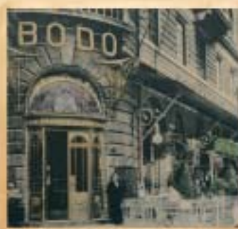
Mindenholon ösztönözték a vendégek Józsefváros kávéházaiba. Kerületünkben híres művészek, feltrájlók éltek.