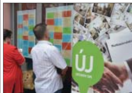
Bővülnek a foglalkoztatást ösztönző programok

Segély helyett munkát – ez a kormány politikájának alapelve. Hosszú távú célja – az üzleti világgal szorosan együttműködve –