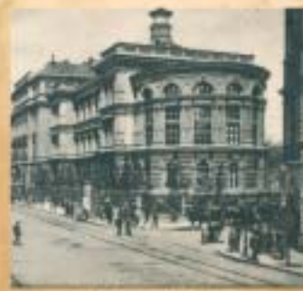
1880-tól kezdve épült fel az orvosegyetem központi főépülete. A képen egykori legszebb része: az Üllői út és a Mária utca sarkán.