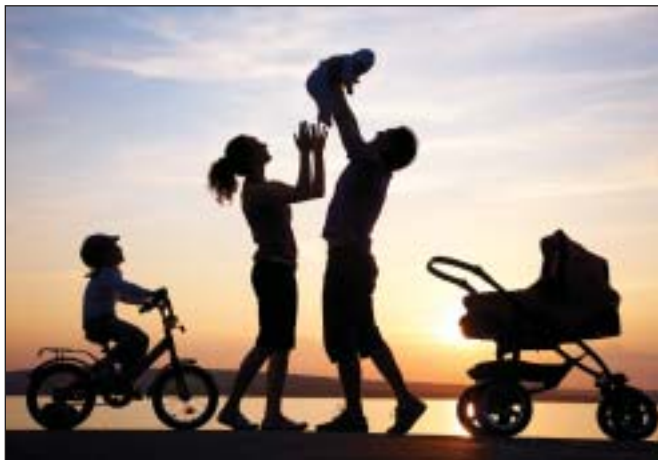
Adókedvezmények a családoknak és az új házásoknak

Folytatódnak, sőt bővülnek a foglalkoztatást ösztönző programok, például a Munkahelyvédelmi Akció, amely 890 ezer fő foglalkoztatását tette lehetővé, és indulása óta már 205 milliárd forinttal csökkentette a munkáltatók terheit. Jövőre a Munkahelyvédelmi Akcióban már rész munkaidőben is jár az adókedvezmény a kisgyermekes szülőknek.