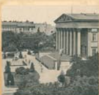
1844-ben Józsefvárosban épült fel a Magyar Nemzeti Múzeum.