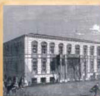
A múzeum mögött kialakuló magánnegyed palotáiba költözött a magyar politikai és gazdasági elit.