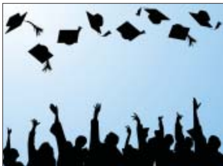
Tízezrek mentenék diplomájukat

nak kíván segíteni, akik nem tudták önerőből finanszírozni a nyelvi képzést, mert a főiskolai/egyetemi évek alatt nem