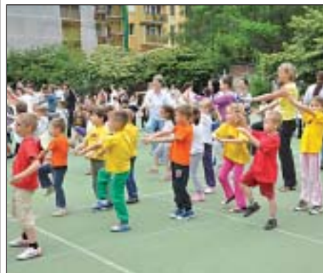
Testnevelés minden tanítási napon

A magyar lakosság, különösen a gyermekek és fiatalok egészségesebb életmódjának elősegítése érdekében a kormány kiemelt fel-