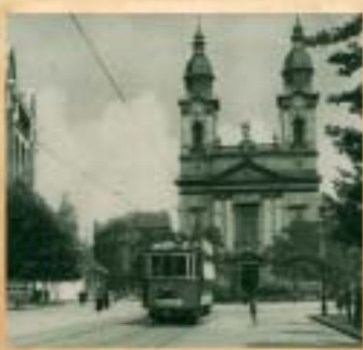
Városunk jelképe lett az 1874-ben épült, majd jelenlegi formájában 1896-ban átadott Szent József plébániatemplom.