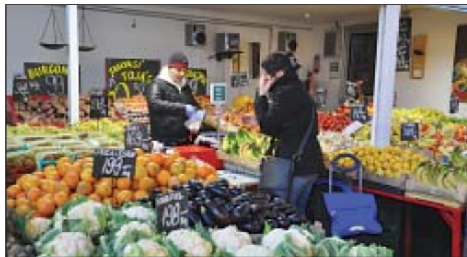
Mivel a bérlési díjakat nem emelték, a zöldség-gyümölcs ára is alacsony maradt

Május elején adták át a teljes egészében önkormányzati beruházásban megépült új Teleki téri piacot. Amellett, hogy sokkal szebb lett, ideálisabb környezet-