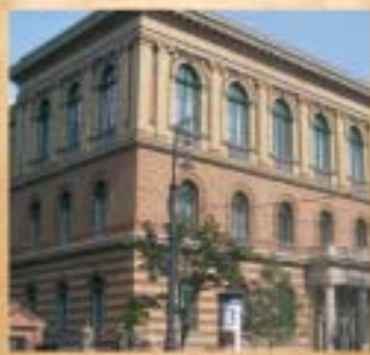
Józsefváros országos közintézményeknek, iskoláknak, egyetemeknek adott otthont. A képen az Eötvös Loránd Tudományegyetem.