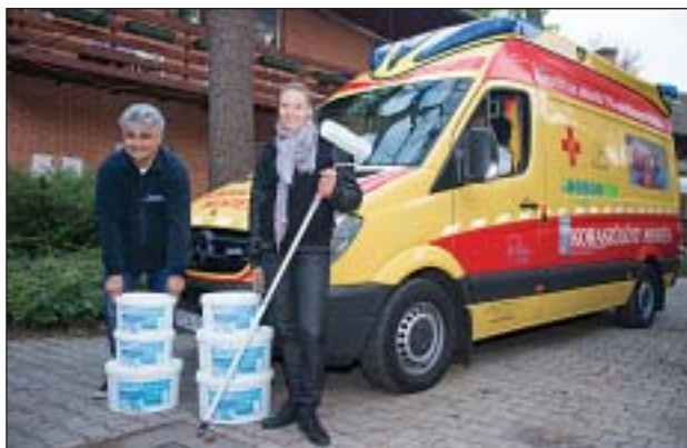
A kétszeres olimpiai bajnok kajakozó is részt vett a felújításban

A munkálatokban részt vett Kozák Danuta jótekonysági sportnagykövet is, aki lapunknak elmondta, hogy mindig szívesen áll hasonló jótekonysági meg-