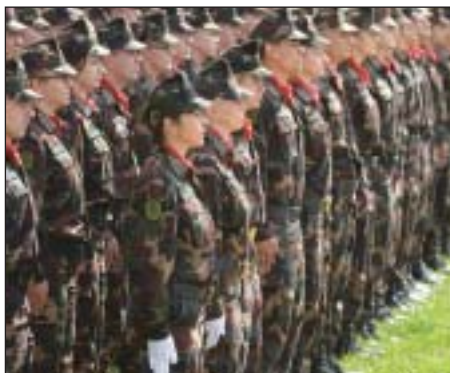
Fegyveres és rendvédelmi életpályamodell indul

2015-ben is folytatódik a pedagógusok béremelése, a tavalyi átlagos 30 százalékos emelés után 2017-ig minden évben növekszik az ágazatban dolgozók bére. Az egészségügyben dolgozók is számíthatnak a kormányra. Már negyedik éve, több lépcsőben zajlik az egészségügyi dolgozók béremelése.