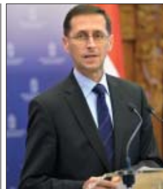
Varga Mihály: népszerű a diplomamentő program

A nemzetgazdasági miniszter 2013. december 30-án döntött a 3