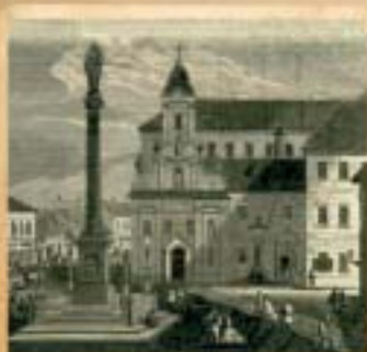
Józsefvárosban létesült Pest-első állandó köznevelési intézménye: az 1798-ban alapított Szent Rókus.