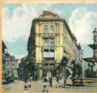
1889-től a Kálvin tér és az Orczy tér között már villamos közlekedett.