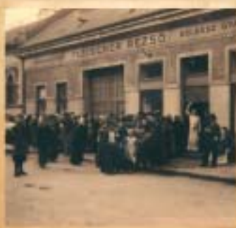
Az iparos szakemberek a nagykörút túloldalán telepedtek le.