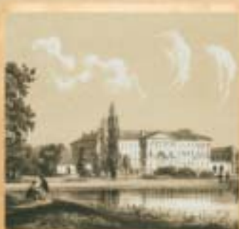
Az ország első nyilvános angol-parkja, az Orczy-kert 1794-ben készült el. 1836-ban itt épült meg a Ludovika Akadémia főépülete.