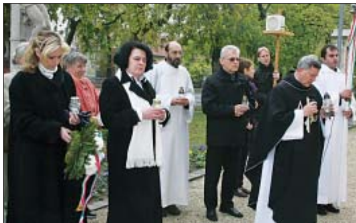
Az 1956-os mártírokra emlékeztek a Rezső téren