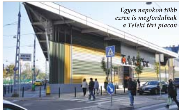
Egyes napokon több ezren is megfordulnak a Teleki téri piacon

ben várja a vásárlókat, és bővebb szolgáltatásokat is nyújt. Jelenleg 43 bérlő van a piacon, szinte minden megkapható, ami a hétköznapokra, a hétvégi vagy akár egy-egy ünnepi alkalomra szükséges lehet. Az azonos ter-