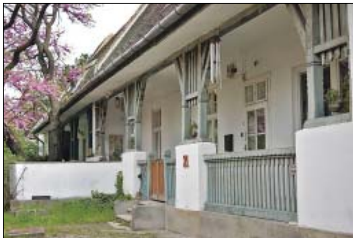
Józsefváros büszkesége: a Százados úti Művésztelep

vészcsaládoknak is. Idén június elsején, a nyitott műterem délutánján, a látogatók közel harminc művész munkásságával ismerkedhettek meg a helyszínen.