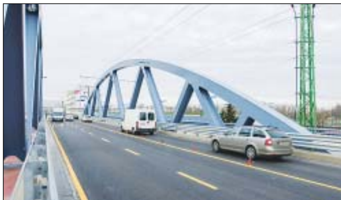
Megindult a forgalom a felújított északi oldalon

Elkészült a „Százlábú híd” északi fele, így december 10-étől ezen haladhat a közúti forgalom. Az ütemváltás miatt az Asztalos Sándor utat a Kerepesi úti kereszteződésnél lezárták. A híd déli felének felújítása várhatóan jövő év őszéig tart.