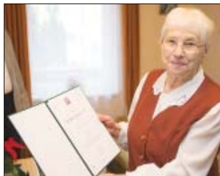
A szépkorú asszonyt virággal és az Orbán Viktor miniszterelnök által aláírt emléklappal köszöntötték

Az idős hölgy egyedül él, férje 1991-ben meghalt. Hegyeshalomban élő fia hetente látogatja, Németországban élő másik fia-