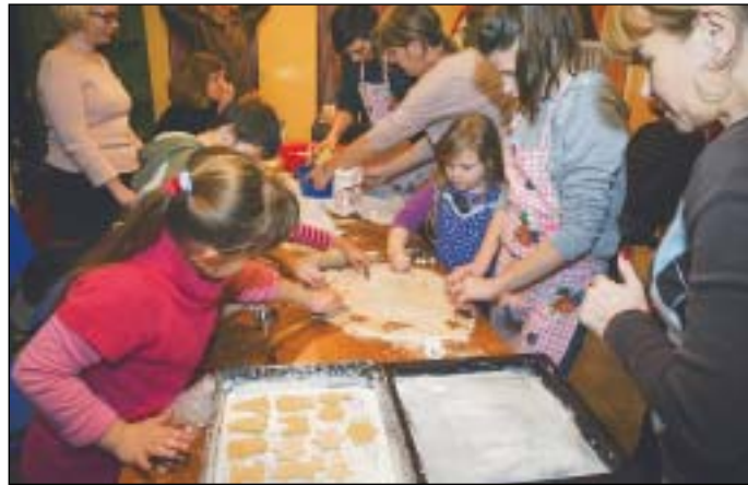
Mézeskalács sütés a Gyermekjóléti Központban

Karácsony közeledtével a legtöbben igyekeznek minél előbb beszerezni az ajándékokat, megvenni a fenyőfát, feltölteni a kamrát, hűtőt, hogy az év utolsó napjaiban a család, a vendégek nyugodt körülmények között pihenhessenek, készülhessenek az ünnepekre. Vannak azonban gyermekek, családok, akik nem csak karácsonykor, de az év többi időszakában is segítségre, támogatásra szorulnak. Rajtuk igyekeznek segíteni a Józsefvárosi Szociális Szolgáltató és Gyermekjóléti Központ munkatársai is.