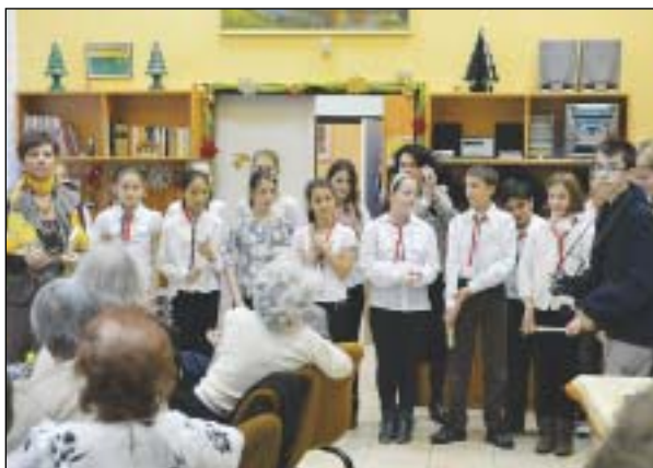
A Vajda iskola ének-zene tagozatos 5. z. osztályja adott műsort