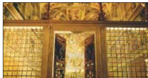
A Sixtus-kápolna bejárata

A háromdimenziós technikával készült dokumentumfilmet Budapesten az Uránia Nemzeti Filmszínházban vetítik.