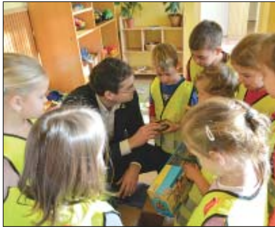
Láthatósági mellényekkel szerelte fel az ovisokat az alpolgármester