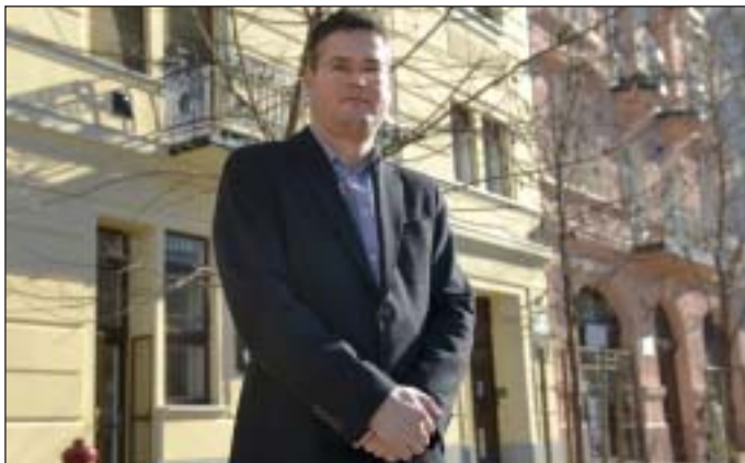
Sára Botond alpolgármester két felújított Mátyás téri társasház előtt

gyors és hatékony munkájukért, hogy ilyen rövid idő alatt elkészültek a házfelújítások. Áprilisban kezdődik 28 önkormányzati bérház felújítása, ami további 700 lakást érint, melyeknek felújítására 1,8 milliárd forintot fordít az önkormányzat.