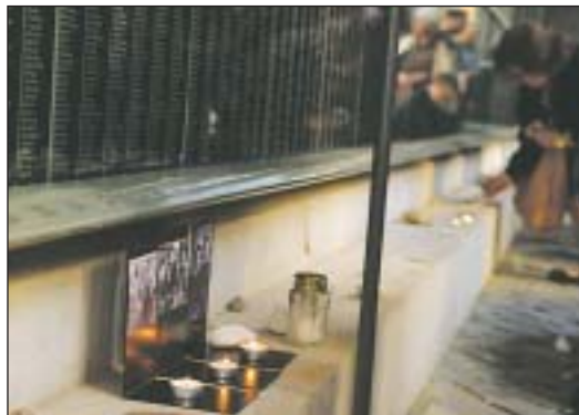
Mécses gyújtottak az áldozatok emlékére

utcai Holokauszt Emlékközpontban Colleen Bell hangsúlyozta, emlékeznünk kell a tragédiákra és tanulnunk belőlük, hogy soha többé ne ismétlődessenek meg. Az amerikai diplomata kiemelte, el kell ítélni a gyűlöletkeltést, a zsidók és keresztények szembeállítására tett kísérleteket.