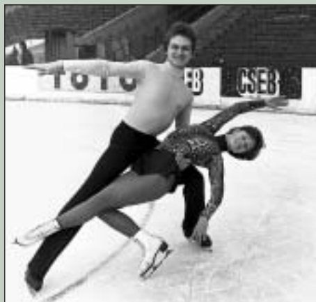
Regőczy Krisztina: Visszahúz a szívem Józsefvárosba

Regőczy Krisztina olimpiai ezüstérmes, világbajnok műkorcsolyázó, sportvezető. A Nemzetközi Korcsolyázó Szövetség sportigazgatója, a MOB elnökségének tagja. Sallay Andrással zsinórban kilenceszeres magyar bajnokok, számtalan Európa-bajnoki és világbajnoki bronz- és ezüstérem tulajdonosai. Pályafutásuk csúcspontja 1980-ban érte, amikor a Lake Placid-i téli olimpián és a göteborgi Európa-bajnokságon ezüstérmesek, a dortmundi világbajnokságon aranyérmesek lettek. 1980 után négy évig az Ice Follies and Holiday on Ice jégrevüvel turnéztak az Egyesült Államokban és Kanadában.