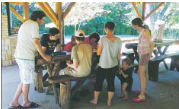
A józsefvárosi gyerekeknek kedvezményes táborozási lehetőséget biztosít az önkormányzat Magyarkúton

Teljes gőzzel üzemel Józsefváros magyarkúti tábora. A vadregényes Börzsönyben fekvő üdülő egész évben nyitva áll a vendégek előtt. A józsefvárosi gyerekeknek és kísérő tanáraiknak idén is kedvezményes feltételeket biztosít az önkormányzat. A káptalanfüredi tábor idén zárva tart, a képviselő-testület ugyanis az üdülő teljes felújításáról döntött.