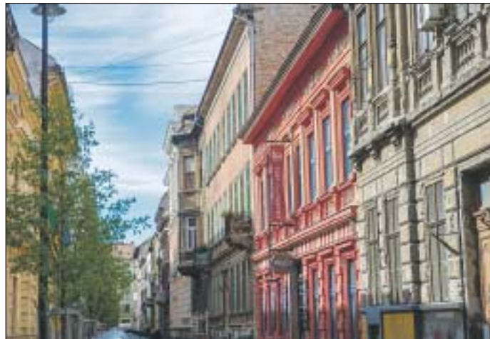
A kerületiek ingyen juthatnának kulturális szolgáltatásokhoz

Kortárs galériák negyedének kialakítása a célja Józsefváros önkormányzatának a Palotanegyedben. A szakmai koncepciót a képviselő-testület elfogadta. Már most is működnek kiállítóhelyek a Bródy Sándor utcában és környékén, de a kerület vezetése azt szeretné elérni, hogy ezek száma jelentősen növekedjen, elsősorban a kortárs képzőművészek bemutatásával foglalkozó galériák kerületbe vonzásával.