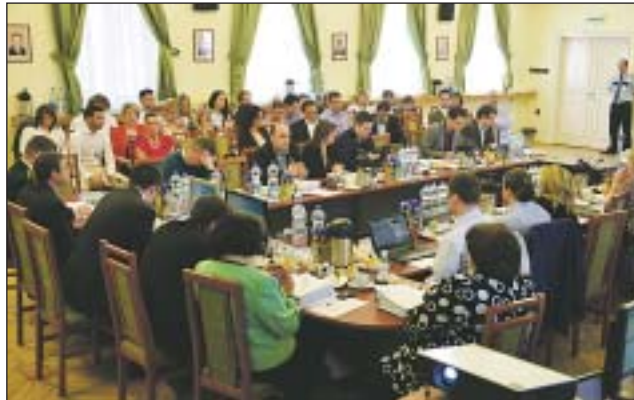
A PM képviselője megszüntetné a Lakatos iskolát

A Józsefvárosi Önkormányzat képviselő-testülete legutóbbi ülésén az iskolaigazgatói pályázatok kapcsán vita alakult ki a Lakatos Menyhért Általános Iskola működésével kapcsolatban. A pályázatok megtárgyalása közben a szakmai vitától teljesen eltávolodva, a jelen lévő iskolaigazgató-jelöltek megdöbbenésére is, a baloldali kispártok képviselői politikai magánakcióba kezdtek. Mint kiderült, a szegregációs problémát az iskola átnevezésével vagy bezárásával oldanák meg. Az önkormányzat vezetése visszautasította felvetéseiket.