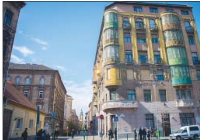
Az épület földszintjén működött egy ideig a Mátyás mozi is

Nagy sikerrel zárult az előző hétvégén ötödik alkalommal megrendezett Budapest100 elnevezésű rendezvény, amelyen fővárosi épületeket ismerhettek meg alaposabban a kíváncsiak. Józsefvárosban is több ház kinyitotta kapuit, a kerületben sokan látogatták meg a Horváth Mihály téri egykori telefonközpontot, illetve a Mátyás téri Magda udvart, ahol a közelmúltban bemutatott Liza, a rókatündér című magyar filmet is forgatták.