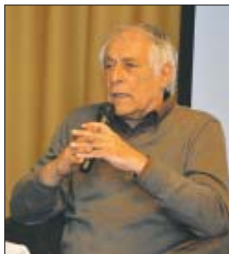
A művész a Kodály-vonósnyegyessel körbeutazta a világot

Az örök városból visszatérve – melyhez ma is erősen kötődik – megalapította a Kodály-vonósnyegyest. A zenekar 50 lemezt adott ki, és 30 éves fennállása alatt bejárta a világot. Kon-