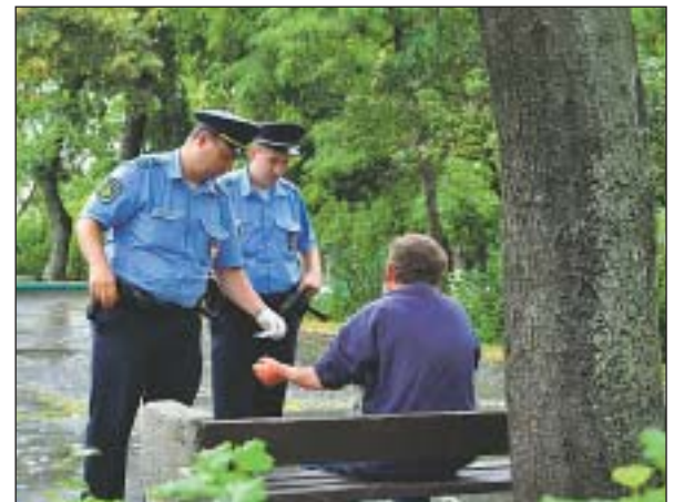
58 százalékkal nőtt a rendőrök közterületi létszáma

A rendőrség a közúti balesetek megelőzése érdekében közlekedési akciókat szervezett. A fokozott rendőri jelenlét ellenére a balesetek száma ugyanakkor növekedett a kerületben, tavaly 2 halálos, 40 súlyos és 151 könnyű kimenetelű személyi sérüléses baleset történt, főleg gyorsjárat, nem megfelelő előzés, elsőbbség meg nem adása, kanyarodási szabályok megsértése miatt. Feladatnak