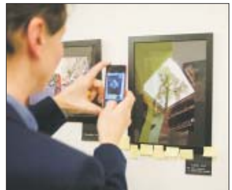
A fotók a H13-ban tekinthetők meg