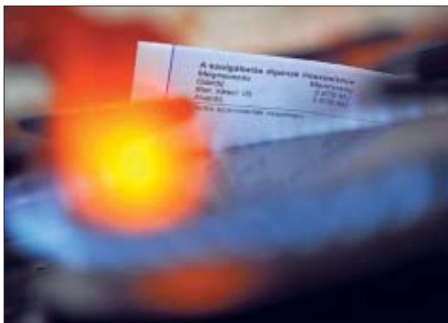
A nemzeti közműszolgáltató célja a lehető legalacsonyabb áron biztosítani a szolgáltatást

Már Ön is az ügyfele lehet az Első Nemzeti Közműszolgáltatónak (ENKSZ) vagy, ahogy sokan hívják, a „rezsiholdingnak”. A nemzeti közműszolgáltató létrehozása része a kormány rezsicsökkentő politikájának. A kormány célja, hogy ne külföldi vállalatok kezében, hanem állami kézben legyen a közműszolgáltatás, ezzel megvédhetőek a rezsicsökkentés eddigi eredményei, tovább erősíthető a magyarok energiaellátásának biztonsága, az ügyfélkiszolgálás egyszerűbbé, gyorsabbá és kényelmesebbé válik.