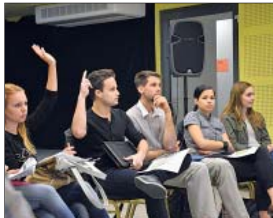
Kifizetési fázishoz érkezik a fiatal vállalkozókat segítő program

Óriási érdeklődés kísérte a tavaly újtárra indult programot. A meghirdetett kétszázas keretszámot többszörösen meghaladó jelentkező nyújtotta be regisztráci-