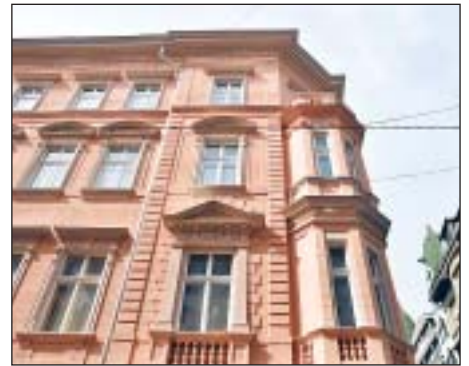
A Szentkirályi utca 17. külső homlokzata szépült meg

A leglátványosabb változáson talán a Szentkirályi utca 17. szám alatti társasház