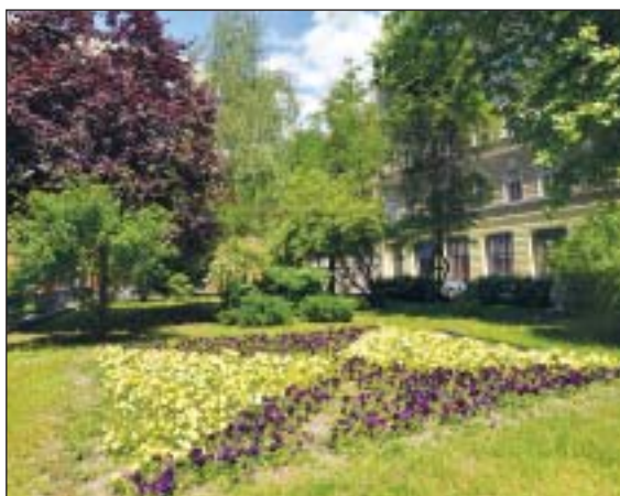
A tér közelében raboskodott Mindszenty József bíboros

A kommunista diktatúra magyar egyházak megtörésére tett egyik leglátványosabb mozzanata Mindszenty József bíboros, Magyarország hercegprímása 1948. decemberi letartóztatása volt. Alig néhány hónappal később, több hétig tartó kínzások után, koholt vádak alapján életfogytig tartó fegyházra ítélték. Büntetését 1949. szeptember 27-e és 1954. május 13-a között a Conti – ma Tolnai Lajos – utca 41. szám alatti, egykori ÁVH-s börtönben töltötte. Mindszenty József rabsága állomásai közül itt töltötte el a leghosszabb időt.