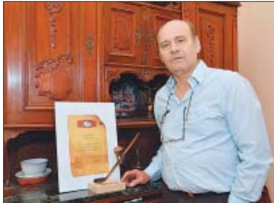
Több, mint kétszázszoros válogatott játékos

Berlinben korosztályos bajnoki címet nyert, 16 évesen tért vissza családjával Magyarországra, itthon azonnal lecsapott rá a Dózsa. 14 évig az Újpest, majd karrierje utolsó hat esztendejében a Fradi játékosa volt. A lilákkal ötször, a zöldekkel háromszor nyert bajnoki címet, a Fradinál összesen 25 évet töltött el, játékos-pályafutása után edzőként erősítette a Ferencvárost. „Mindkét klub egyformán kedves a szívemnek” – mondja.