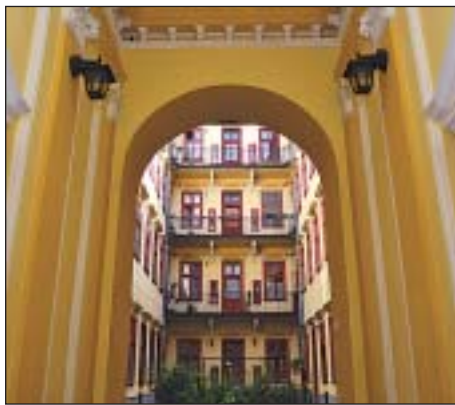
A Krúdy utca 5. belső terei újultak meg