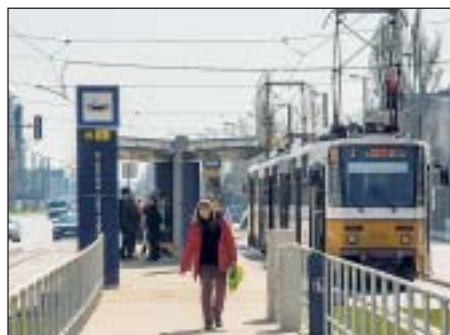
Mindkét irányban meghosszabbítják az 1-es villamos vonalát

Az uniós forrásból megvalósítandó fejlesztések a közlekedésre irányulnak. Az 1-es villamospálya meghosszabbítása Kelenföldig – valamint a vonal északi végében –, a kötöttpályás közlekedési lehetőség a Keleti pályaudvar és Újpalota között, illetve a Kelenföld és Órmező között megvalósítandó