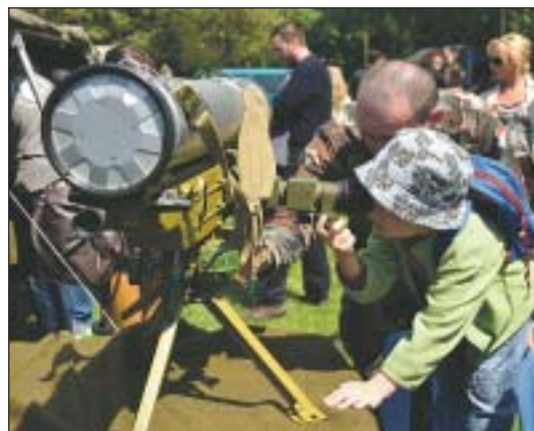
Népszerű volt a Metis-M páncéltörő ágyú

ügyességgel, népszerű rock-számokra és katonai filmek zenéjére mutatták be látványos díszelgéseiket.