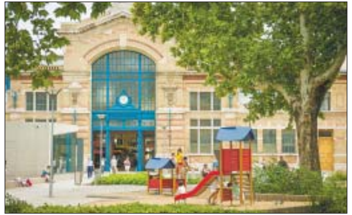
A Rákóczi téren megjelenik Józsefváros sokszínűsége

Az Egy nap a városban blogon négyrészes sorozatban foglalkoznak a Rákóczi térrel, bemutatják, hogy mi minden található a környéken, hová lehet beülni, mit lehet ott csinálni.