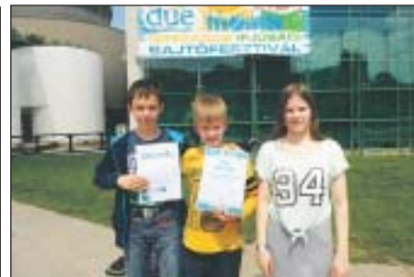
A jövő újságírói a Vajdában

az iskolában: a Dobd a kosárba! országos döntőn csoportelsők lett a vajdások. A 2012-ben indult program az oktatási intézmények