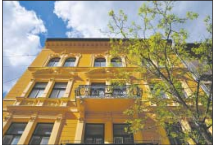
500 millió forintot fordítanak a társasházak felújítására

velelővel. Az önkormányzat a pályázatok elbírálására munkacsoportot hoz létre. Kocsis Máté elmondta, hogy a kerületnek 0 forint tartozása van és a felelős gazdálkodásnak köszönhetően megmaradt tartalék mértéke miatt az idei büdzsé egy fejlesztésorientált költségvetés lesz. A polgármester idén kiemelt feladatként említette az óvodák és bölcsődék fejleszté-