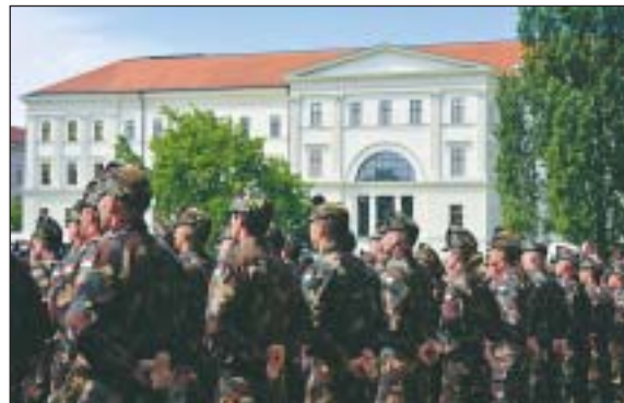
Kitüntették a legjobb végzős hallgatókat

A kitüntetések átadása után az MH Központi Zenekara tartott zenés katonai felvonulást, majd a Különleges Díszelgő Csoport mű-