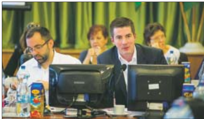
Kocsis Máté: a felelős gazdálkodásnak köszönhetően az idei büdzsé fejlesztésorientált költségvetés lesz

tőségek keretében. A fő cél természetesen a józsefvárosi lakosok életkörülményeinek javítása, élhetőbb lakókörnyezet ki-