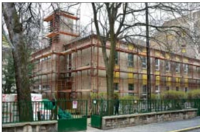
301 millió forintból korszerűsítik a nevelési intézményeket

alakítása. Ennek keretében további 301 millió forintot fordítanak a nevelési intézmények felújítására.