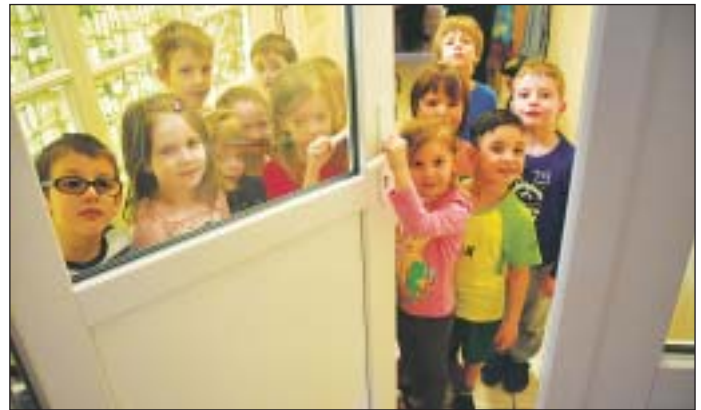
A strukturális átalakítás az óvodásokat és szüleiket nem érinti

intézményt, aki folyamatosan tartja a tagóvoda vezetőivel a kapcsolatot. Az óvodák vezetői ugyanazok a személyek maradnak, akik korábban. A testületi ülésen felszólalt az óvodavezető