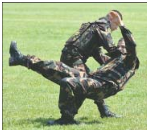
Közelharc-bemutatót is láthattunk