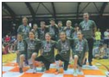
A vajdások veretlenül lettek csoportgyőztesek

Az egyik legrangosabb országos diákújságíró versenyen, a DUE Tehetségkutató Diákmedia Pályázaton a Vajda Péter Ének-zenei Általános és Sportiskola két díjat is nyert. A józsefvárosi iskola kosarasai pedig országos versenyen diadalmasok voltak.