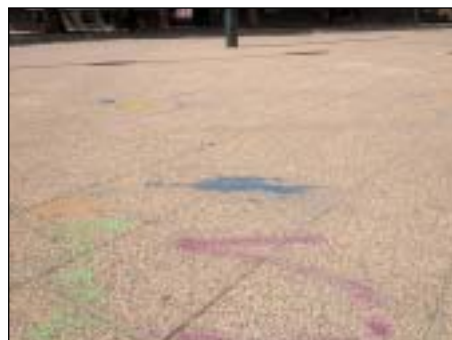
A festék csak költséges eljárással távolítható el

Május 16-án Roma Ellenállás Napja címmel megemlékezést tartottak romák arra emlékezve, hogy 1944. május 16-án Auschwitzban a cigány láger rabjai felázadtak az SS-őrök ellen, akik gázkamrába akarták terelni őket. A Mátyás téren tartott rendezvényen azonban a résztvevők több helyen festékszóróval rongáltak