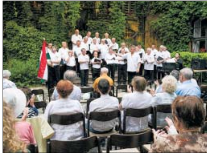
A megemlékezésen a Kodály Zoltán Férfikar adott ünnepi műsort