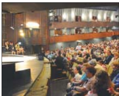
Négyszáz kerületi kisdíák tekintette meg a meseoperát az Erkel Színházban

Akiket a tűzoltók élete érdekelt, az a VIII. kerületi tűzoltóság programját választhatta,