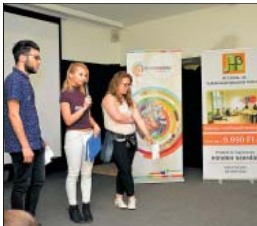
Már diákként a közösségért tevékenykednek

Mintegy 60 budapesti középiskolás érkezett arra a szakmai fórumra, amelyet az Új Nemzedék Plusz Kontaktpont pesti irodája szervezett a H13 Diák és Vállalkozásfejlesztési Központban kifejezetten a diákönkormányzatok fejlesztése érdeké-