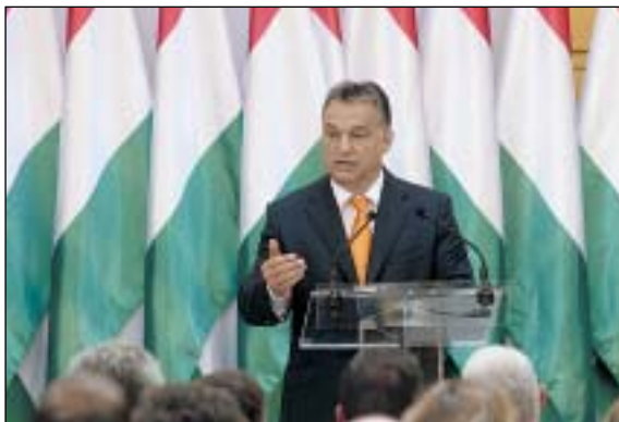
Orbán Viktor: A kormányzás kulcsszava mostantól a figyelem

Magyarország felemelő átalakuláson ment át 2010 óta. A miniszterelnök megemlítette a gazdasági növekedést, a bővülő foglalkoztatottságot, a nulla közeli inflációt, a nyugdíjak értékének növelését, az adók és a rezszi csökkentését, az óvodások túlnyomó többségét érintő ingyenes étkeztetést, a multik és a bankok közteherviselésben való részvételét, a bankok által megkárosított ügyfeleknek nyújtott állami igazságszolgáltatást, a rendőrség létszámának emelését és Budapest buszparkjának meg-