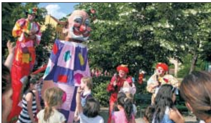
Böhócok szórakoztatták az aprónépet a kesztyűgyári gyermeknapon

ugyanis vasárnap megnyitotta titokzatos kapuit a Dologház utcai katasztrófavédelmi központ. Volt próbariasztás is: