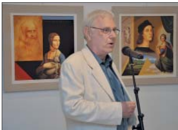
Minden festmény egy arckép és egy műalkotás montázsza