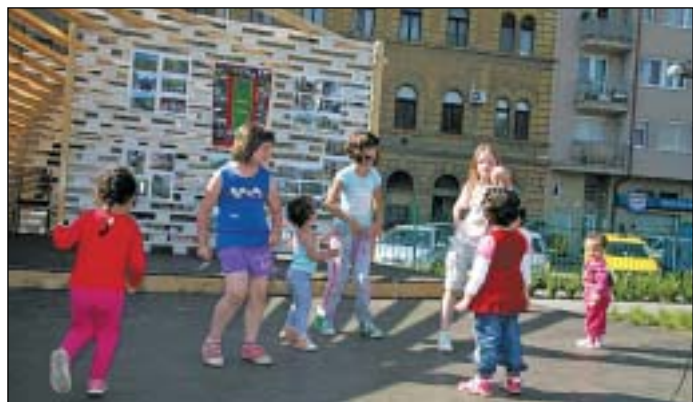
A Teleki tér színpada is megtelt gyerekekkel