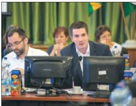
Újabb 80 millió forintot szavaztak meg az intézmények fejlesztésére