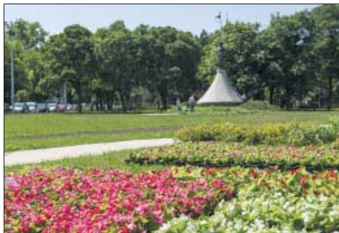
A Rezső térre több mint 6300 tő virágot ültettek ki

A Józsefvárosi Városüzemeltetési Szolgálat tájékoztatása szerint a kerület több közterére mintegy 11 ezer tő virágot ültetnek ki. A legtöbbit a Rezső térre, de kerül virág a Horváth Mihály, a Mindszenty, a Nap és a Molnár Ferenc térre is. A fővárosi fenntartású városrétől