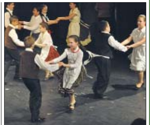
Fergetegesen táncoltak az alsós diákok

padra. A közönség az összes fellépőt vastappsal jutalmazta. A tankerület anyagi segítségének köszönhetően a Zagya Banda zenekar élő zenével kísérte a táncokat. A remek hangulatú délutánt fergeteges táncbál zárta, amelybe a szülők, a vendégek is bekapcsolódtak.