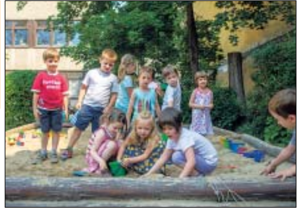
Tovább szépülnek a játékkudvarok is

Tovább folytatódik a józsefvárosi óvodák fejlesztése: a képviselő-testület legutóbbi ülésén újabb 80 millió forintot szavazott meg az intézmények karbantartására, felújítására. A pályázati forrásokkal együtt idén összesen 440 millió forintot fordítanak az óvodák korszerűsítésére. A Corvin negyedben is új óvodát építené az önkormányzat.