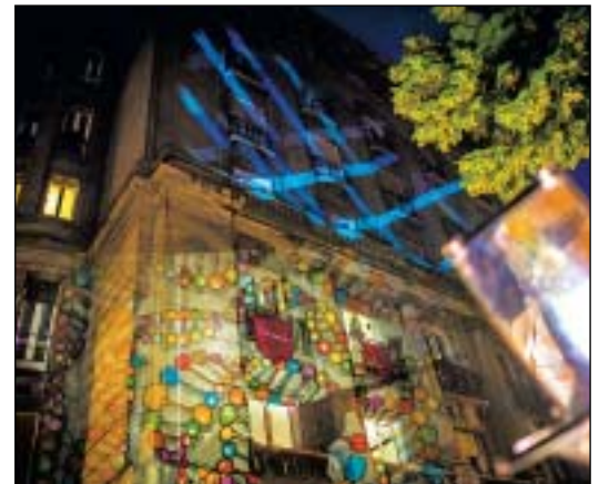
Különleges hangulatot varázsoltak az épületekre a fényfestők

A délután folyamán az érdeklődők hintózhattak is egyet Palotanegyed utcáin, az estét a Four Fathers énekegyüttes koncertje és fényfestés zárta.