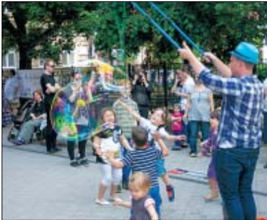
Zsonglőrbemutató és óriásbuborék-fújás szórakoztatta a gyerekeket

Hagyományteremtő céllal, első alkalommal rendezték meg a Bródy-pikniket a Bródy Sándor utcában és a Gutenberg téren május 30-án, szombaton. A színes rendezvényen kicsik és nagyok egyaránt változatos programokon vehettek részt.