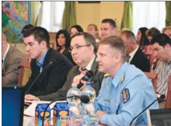
Bucsek Gábor, budapesti rendőrfőkapitány: Fontos a társadalom tagjaival kialakított minél szorosabb kapcsolat

Több önkormányzat – így a IX. és a XX. kerület – is átveheti a sikereket maga mögött tudható Bűnmegelőzés és áldozatsegítés Budapesten, Józsefvárosi programmal elnevezésű projektet, amely hozzájárult a józsefvárosiak biztonságérzetének növekedéséhez. A program részeként létrejött Józsefvárosi Áldozatsegítő Szakmai Együttműködési Rendszer (JÁSZER) múlt szerdai ülésén Bucsek Gábor budapesti rendőrfőkapitány és Kocsis Máté polgármester mellett több szakmai szervezet is részt vett. A JÁSZER elnöke, Zentai Oszkár szerint a program sikeressége a szoros együttműködésben, a társadalmi összefogásban rejlik.