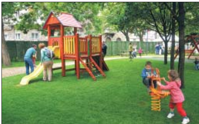
A csúszdás vár volt a legnépszerűbb az új játszótéren

Már pénteken elkezdődtek a gyermeknap rendezvények Józsefvárosban. A programsorozat a Horváth Mihály téren indult az új játszótér megnyitásával. Még aznap délután trambulín, ugrálóvár és állatsimogató is volt a Kesztyűgyárban. Szombaton a Múzeumkert várta a családokat, vasárnap az Erkel Színház, a Horváth Mihály tér, a Teleki tér és a józsefvárosi tűzoltók kínáltak színes programokat.