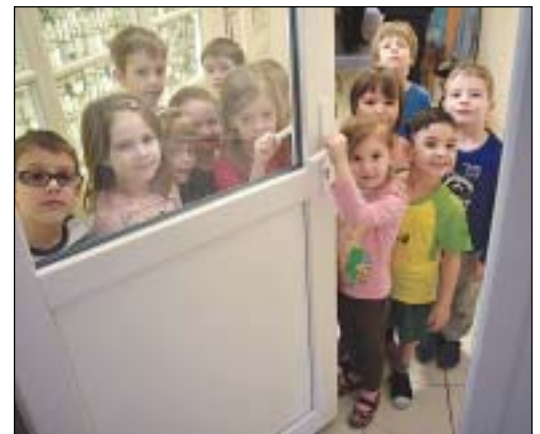
Több óvodában energetikai korszerűsítés valósul meg, kicserélik a nyílászárókat is

az új intézmény a Corvin negyedben, addig az óvodát más épületben helyeznék el. Az előkészítő munka elkezdődött, az