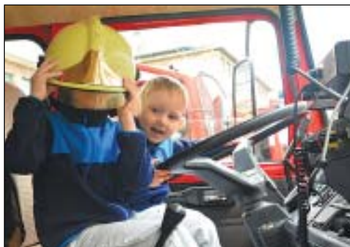
A Dologház utcában a tűzoltóautókkal ismerkedtek a kicsik

színes várapot építettek. A Hókirálynő Meseszínház művészei zenés népi mesejátékkal szórakoztatták a csöppsegeket.