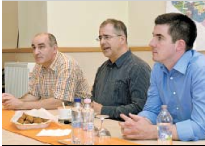
Kósa Lajos: Fontos a diákok, a családok és az időskorúak támogatása

Kósa Lajos kiemelte: sikeresnek bizonyult a devizahitelek megmentése, Magyarországon nőnek a reálbérek, ahogyan a fogyasztás is. Mint elmondta, fontos a gyermekek, az diákok, az egyetemisták, a családok valamint az időskorúak támogatása. A