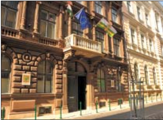
Új és már működő vállalkozásokat is segítenek

Újabb támogatást nyújt a fiatal vállalkozóknak Józsefváros önkormányzata: ezúttal kedvezményes bérleti díjat állapítanak meg a nem lakáscélú ingatlanok bérlésére Józsefvárosban. A kedvezményben a H13 Diák és Vállalkozásfejlesztési Központ programjaiban részt vevő, józsefvárosi székhellyel rendelkezők részesülhetnek.