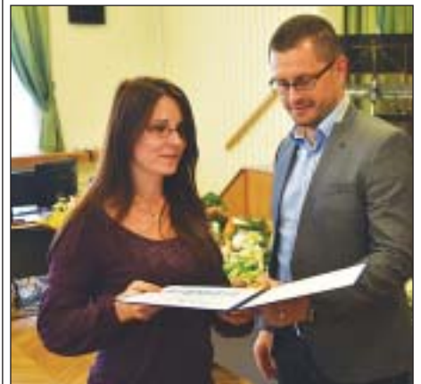
Főigazgatói dicséretben részesítették a JESZ több munkatársát is

Dr. Sára Botond alpolgármester ünnepi beszédében kiemelte, hogy az egészségügyi dolgozók által végzett munka felelőssége valamennyi hivatás felett áll. Az alpolgármester kitért az egészségügy javuló helyzetére is. „Az év elején volt mód a háziiorvosok támogatására, elindult a bérrendezés, itt épül a közvetlen környezetünkben a Semmelweis Egyetem új Központi Betegellátó Épülete. Emellett folynak a kerületi beruházások is, hiszen önök most úgy végzik munkájukat, hogy közben a fejük fölött átépítik az intézményt.” Sára Botond hozzátette, személyen is megtapasztalta, hogy az Auróra utcai szakrendelőben fegyelmetten, összehangoltan zajlik a felújítás, mind a dolgozók, mind a vállalkozó oldaláról, és türelemmel a kerületi lakosok részéről.