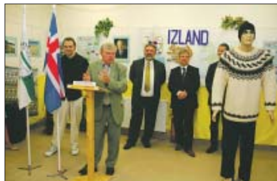
Izland után Etiópia, Tunézia és Észak-Ciprus is bemutatkozik a Zászlómúzeumban