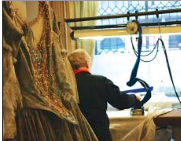
Operaelőadásra készül ez a jelmez