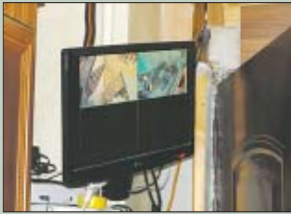
A dílerek kamerával figyelték a bejáratot

Elfogták a józsefvárosi rendőrök azt a két férfit, akik egy Diószegi utcai lakásban árultak rendszeresen új típusú pszichoaktív kábítószerrel. A házkutatás során fehér kristályos anyagot, adagoláshoz szükséges eszközöket és készpénzt foglaltak le. A kábítószer-terjesztők a Diószegi utcai lakás bejáratát kamerával figyelték, hogy mindig lássák, éppen ki érkezik hozzájuk. Azonban ez sem mentette meg őket a lebukástól.