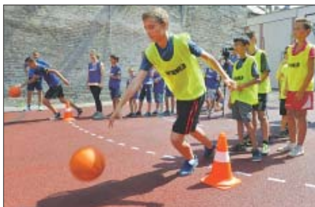
Több program lesz a Dankó és a Homok utcai sportpályákon

Az együttműködés értelmében a civil szervezetek rendszeresen programokat szerveznek majd a Homok és a Dankó utcai sportpályákon a környékbeli gyermekeknek, családoknak és a fogyatékkal élőknek.