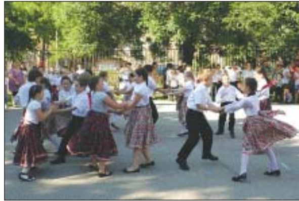
Az alsósok néptáncsal köszöntötték a nyarat

A Vajda Péter Ének-zenei Általános és Sportiskola minden évben két nagyszabású programot rendez május-június fordulóján. Az idei tanévben immár 20. alkalommal, a Ferencvárosi Művelődési Központban tartották az Ilyenek vagyunk című gálaestet, ahol a tanulók és a pedagógusok színes, táncos-énekes műsor-számokkal mutatták be, hogy a tanórán kívül milyen sokrétű az iskola tevékenysége. A jubileum alkalmából nemcsak a