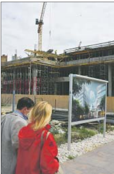
Az új, 25 ezer négyzetméteres székház már épül, a Nokia 2017-ben költözik be