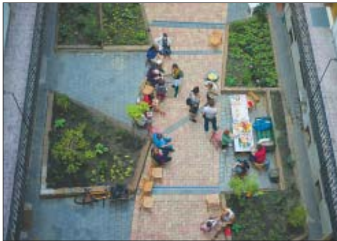
Zöldbe borultak a társasház belső udvarai

A 12-es számú ház az egyik, ha nem a legnagyobb társasház a Gyulai Pál utcában. Száztíz, zömmel kis alapterületű lakással rendelkezik, amelyek többsége két hatalmas belső udvarra néz. Néhány évvel ezelőtt még szürke beton fedte az udvarokat, mára azonban mindkét belső teret virágágyások, zöld felületek és díszes burkolat színesíti az ott lakók nagy öröme. Az első udvar már korábban, a hátsó a napokban készült el. A lakóközösség a felújítások elkészültét közös bográcsozással ünnepelte meg.