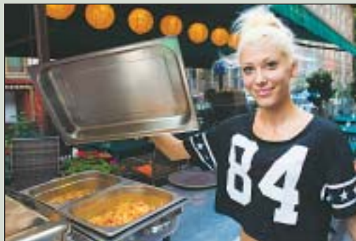
Többfajta lecsót is megkóstolhatunk

Épp ezért jöjjön el, és kóstoljon meg minél többet a helyben készített lecsó és fröccs kreációkból július 3. és 5. között a Mikszáth téren!