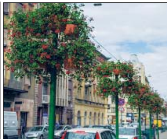
retnék, ha a Népszínház utca visszakapná régi hangulatát. „A virágtartó oszlop-