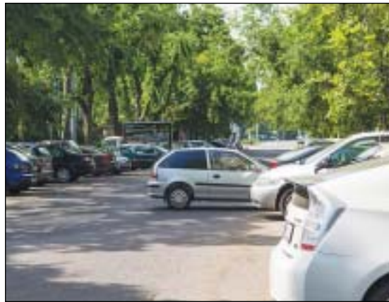
Az engedélyeket térítésmentesen igényelhetik a kerületiek

A lakossági várakozási hozzájárulások kiadása 2015 januárjától térítésmentes. Az engedélyek kiadásának feltételei változatlanok: a legfontosabb a kerületben állandó bejelentett lakcím, a forgalmi engedélybe