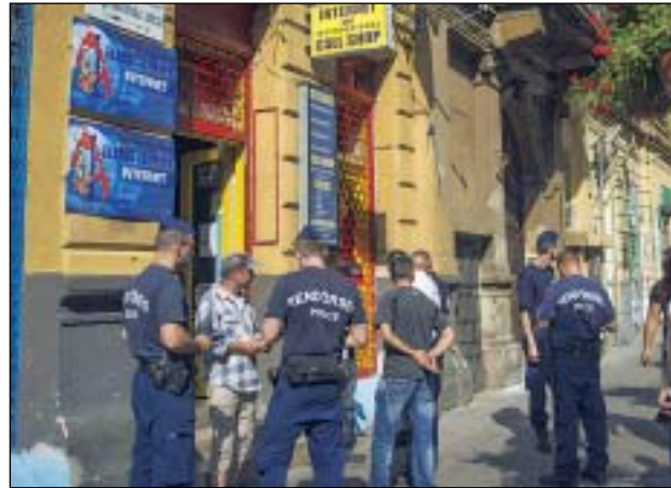
Az illegális bevándorlók kedvelt helyei a call shopok

A legutóbbi ellenőrzésre elkísértük a közterület-felügyelőkől és rendőrökből álló csapatot. A közterület-felügyelethez beérkező panaszok alapján az útvonal első állomása a Népszínház utcai call shopokra (nyilvános internetezőhely) és környékükre fókuszált. A rendőrök itt tizenkét főt ellenőriztek. Mialatt a rend-