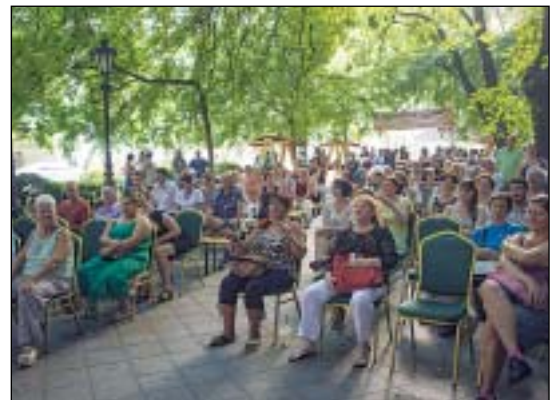
Sokan voltak kíváncsiak az Etnozene Vigadalomra