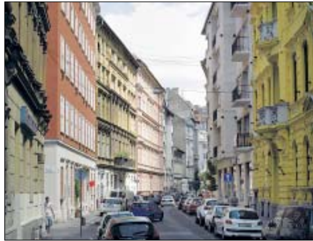
A Bródy Sándor utcában több helyiséget is felújítanak

Ennek a megvalósítása már csak azért is lehetséges, mert a TÉR_KÖZ „A” jelű pályázatban kiemelten szerepel az utcára nyíló, üres földszinti helyiségek közösségi célú felújítása. A Kortárs Galéria Negyed kialakításával pedig az önkormányzat ezt a célt tűzte ki maga elé. Hiszen a negyed éppen a