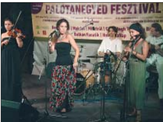
Szombat este a Makám szórakoztatta a közönséget

Idén ötödik alkalommal kerül megrendezésre a Józsefvárosi Önkormányzat által finanszírozott Palotanegyed Fesztivál. A szeptember elejéig tartó, havonta egy-egy hétvégét felölelő rendezvénysorozat kétnapos Etnozene Vigadalommal vette kezdetét július 18-án a Szabó Ervin téren.