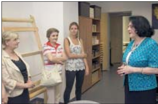
A Magdolna utcában segítséget kapnak a rászoruló nők

A Magdolna utca 47. szám alatt található Fókusz Női Közösségi Központban valósul meg a „Társadalomból kirekesztett nők foglalkoztatása és rehabilitációja” című program 2015. június 15-től. A szakmai felügyeletet a Kesztyűgyár Közösségi Ház látja el. A megnyitón Sántha Péterné alpolgármester asszony hangsúlyozta, hogy milyen fontos szerepe van egy közösségi térnek, ha hátrányos helyzetű emberekről, legfőképpen, ha nőkről, anyákról van szó.