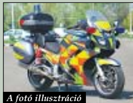
A fotó illusztráció

Éppen egy VIII. kerületi ház udvarán látott el egy férfit, amikor ellopták egy mentőmotoros értékeit. Az Országos Mentőszolgálat szóvivője Gyórfi Pál elmondta: a motoros az