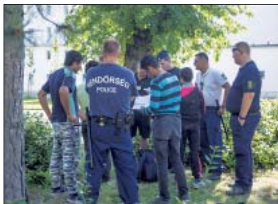
A közparkokban rendszeres a migránsok jelenléte

A Népszínház utcából a közeli II. János Pál pápa térre vitt az utunk. Egy kisebb migráns csoport a rendőrségi autókat