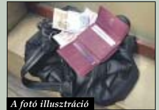
A fotó illusztráció