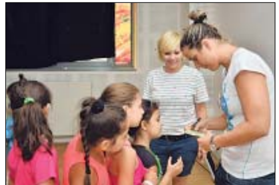
Risztov Éva olimpiai bajnok hosszútávúszó előadása végén autogram-kártyákat osztott a gyerekeknek

A hosszútávúszótól azt is megtudtuk, hogy édesanyja a szomszédos kerületben la-