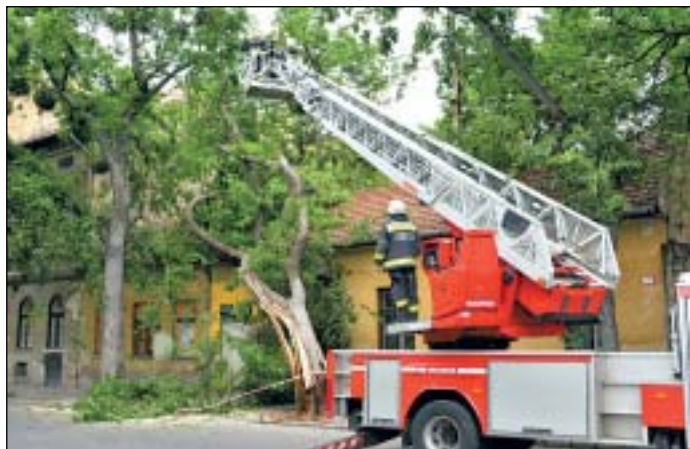
A Diószegi utcában egy házra dőlt a viharban megsérült fa

Az elmúlt évek legnagyobb vihara csapott le Budapestre. Kerületünkben 42 fa esett a tomboló szél áldozatául, melyek tetőszerkezeteket, autókat, felsővezetékeket rongáltak meg. A károk helyreállításán a katasztrófavédelem, a józsefvárosi polgárőrök és a közterület-felügyelet munkatársai is dolgoztak. Az elmúlt hetekben 30 gépkocsikárt jelentettek be a lakosok.