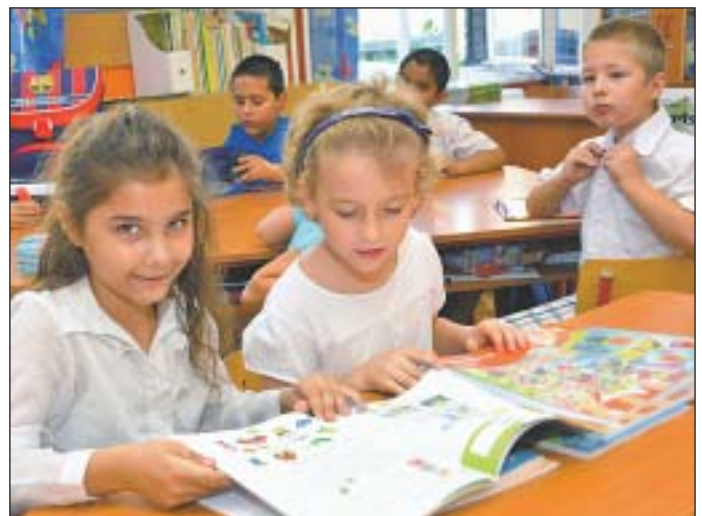
Az 1-3. osztályosoknak ingyen jár a tankönyv

A tanév 181 napos és rendje szerint az őszi szünet október 26-tól október 30-ig, a téli december 21-től december 31-ig, a tavaszi szünet 2016. március 24-től március 29-ig tart majd. Lesz kompetenciamérés a mostani tanévben is, ezt 2016. május 25-én tartják. D.A.