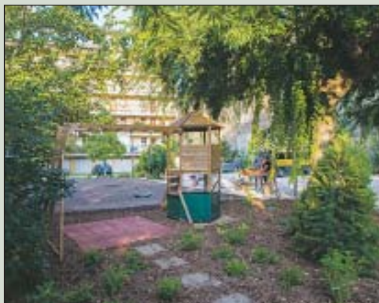
Pályázati forrásból lett otthonosabb az udvar

A lakók kényelmét szolgálja a megújult belső udvar: az elnyert összegből hintát helyeztek ki a kisebbeknek, növények telepítésével, fűvesítéssel tették otthonosabbá a lakókörnyezetet. A társasház először pályázott egy közös célért, de nem szeretnének megállni, folytatni szeretnék az együttműködést az önkormányzattal. Ettől nem zárkozik el a