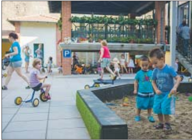
A bölcsődések és óvodások 90 százaléka ingyenes étkezésben részesül

Józsefvárosban hét önkormányzati bölcsőde működik, az összes férőhelyek száma 492. Az elkövetkezendő hetekben 254 gyermek kezd az intézményekbe járni, szeptember-október a beszoktatás legsűrűbb időszaka. Az őszi kezdésre több kerületi bölcsődében történtek fejlesztések.