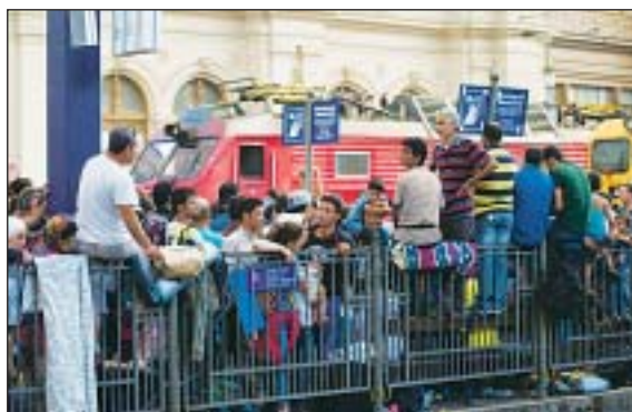
Megrohmozták a migránsok a nemzetközi vonatokat

A feszült helyzet hétfő reggel 6 órakor enyhült, amikor felszállhattak a Münchenbe induló vonatra azok a bevándorlók, akik érvényes jeggyel rendelkeztek. A nemzetközi pénztáraknál hatalmas sorok alakultak ki, ahol a jegy megvásárlásához nem kérték a személyi okmányokat.