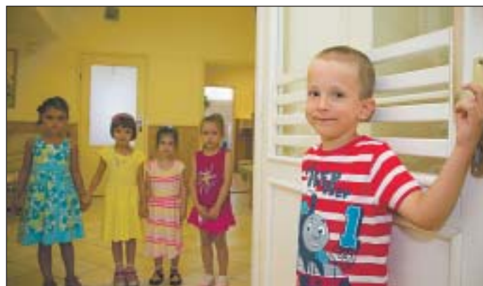
Folyamatosak a fejlesztések a kerületi óvodákban

A 15 kerületi intézményben összesen 1654 gyermeket tudnak fogadni, körülbelül 150 hely áll még rendelkezésre. A jelenlegi jogszabályok szerint, aki szeptember elsejéig betölti a harmadik életévét, annak kötelező óvodába járnia: József-