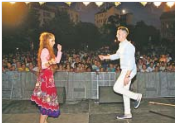
Táncbemutatók is szórakoztatták a közönséget