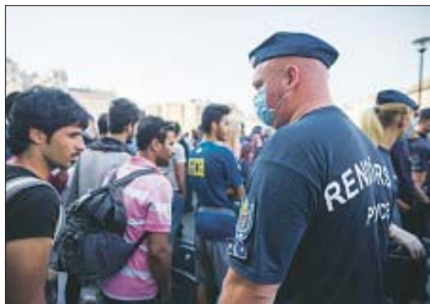
A főváros minden segítséget megad a rendvédelmi szerveknek