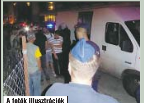
A fotók illusztrációk

A józsefvárosi rendőrök augusztus 29-én, 2 óra 45 perckor intézkedtek egy magyar forgalmi rendszámú kisteherautó magyar állampolgárságú sofőrjével szemben. A férfi 4 szír és 1 afgán állampolgárt akart Röszkéről illegálisan Ausztriába juttatni. A további eljárást a Budapesti Rendőr-főkapitányság Feldehívó Főosztálya folytatja le.