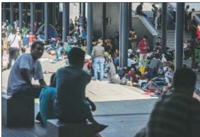
Naponta átlagosan 3000 illegális bevándorló érkezik hazánkba