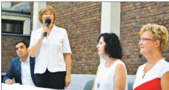
Az igazgató asszony megköszönte a szülőktől kapott bizalmat

Mi, pedagógusok már nagyon vártuk szeptember elsejét, mindig nagyon örülünk,