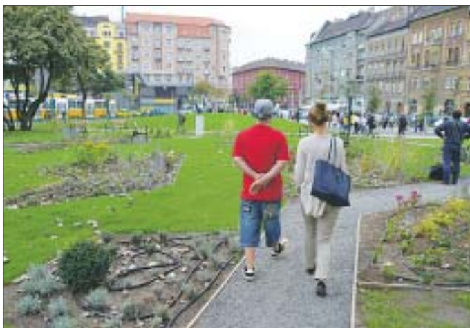
A Teleki tér a FiDo térrel együtt külön dicséretet kapott