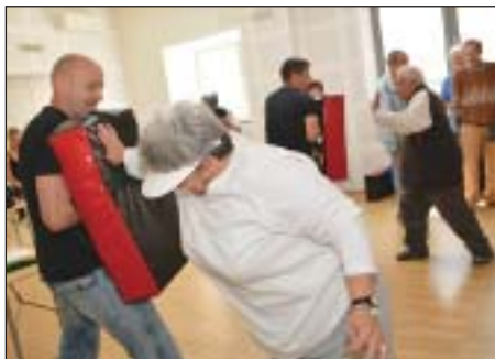
A legtöbben csoportfoglalkozásokon és az önvédelmi tréningeken vettek részt

a kutatás kiemeli, a lakosok körében 2014-ben ezen információk legfontosabb forrása a Józsefváros újság volt. A rendőrség, a polgárőrség és az önkormányzat bűnmegelőzési munkáját a lakosok és a szakértők is hatékonyabbnak látták 2014-ben, mint egy évvel korábban.