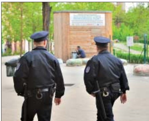
A fokozott rendőri jelenlét nagyobb biztonságot nyújt

A józsefvárosi lakosság biztonságérzetét jelző mutató 25 százalékkal, a rendőrség, a polgárőrség, az önkormányzat bűnmegelőzési munkájával való elégedettségi mutató pedig 20 százalékkal nőtt 2014-re az előző évhez képest – közölte a Társki Társadalomkutatási Intézet a napokban közzétett felmérésében. A kerület közbiztonságát érintő intézkedései, nagyszabású fejlesztései, a bűnmegelőzési és áldozatsegítő szakmai koncepciói meghozták az eredményt. A közvélemény-kutatás szerint Józsefvárosban javult a közbiztonság: az emberek nyugodtabban sétálnak az utcán.