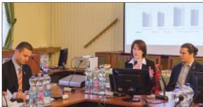
A közterek, a közbiztonság fejlesztése és a modellprogram eredményeként, a Tárki felmérése szerint jelentősen javult a biztonság a kerületben

A 2013 tavaszán indult „Bűnmegelőzés és Áldozatsegítés Budapesten, Józsefvárosi Modellprogrammal” keretében alakult meg az áldozatokkal kapcsolatba kerülő szakemberekből álló csoport, a JÁSZER, amelynek hármas célja: a bűnmegelőzés, az áldozattá válás