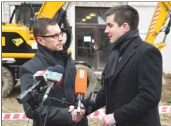
A másfél milliárd forintos rendelő a józsefvárosiak egészségbiztonságát szolgálja

Az Auróra utcai szakrendelő felújítása a józsefvárosiak egészségbiztonságát szolgálja, továbbá egy olyan korszerű épület jön létre, amely fővárosi szinten egyedülálló lesz – mondta Kocsis Máté polgármester az intézmény új épületének ünnepélyes alapkövetelésén.