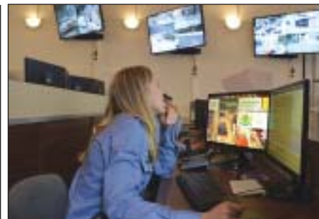
180 új kamera őrzi a kerületiek nyugalmát

Az eredmény önmagáért beszél: a kutatás szerint a józsefvárosi lakosság mind Budapest, mind a kerület, mind a szűkebb lakókörnyezetet vizsgálva sok tekintetben javulást tapasztalt. Positívan változott a közbiztonság, a rendőrség és a lakosság kapcsolata, jobban észrevehető a polgárőrség jelenléte, jobb a vagyonvédelmi eszközökkel való ellátottság, javult az áldozatok segítése.