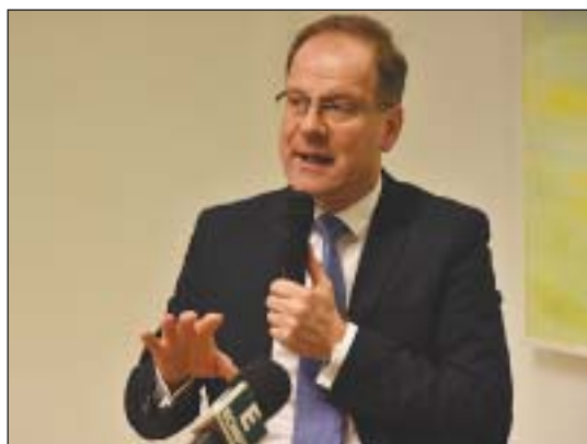
Navracsics Tibor: a nemzetek minél jobban ismerjék meg egymást

Navracsics Tibor azon az állásponton van, hogy ne egységes európai „nemzet” létrejöttét erőltessük, hanem olyan európai közösséget építsünk, melynek alapja, hogy a nemzetek minél jobban megismerjék egymást. A biztos szerint magyar részről ennek lényeges eleme lenne az, hogy ne csak arra legyünk büszkék, hogy micsoda kulturális teljesítményekre vagyunk képesek, de ezeket be is tudjuk mutatni a világnak. Ne várjunk arra, hogy mások fedezzék fel az értékeinket, hanem mi terjesszük ezeket. Ennek fontos eleme lenne a magyar kultúr-