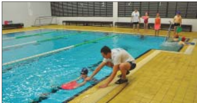
A kerületi iskolások a Losonciban tanulhatnak úszni

Az intézmény földszintjén található uszoda egy időben épült az iskolával, 1983-ban adták át. 2013. január elsejétől a Józsefvárosi Intézményműködtető Központ (JIK) üzemelteti. A 25 méteres, feszített víztükrű, négy sávós, 170 centiméter