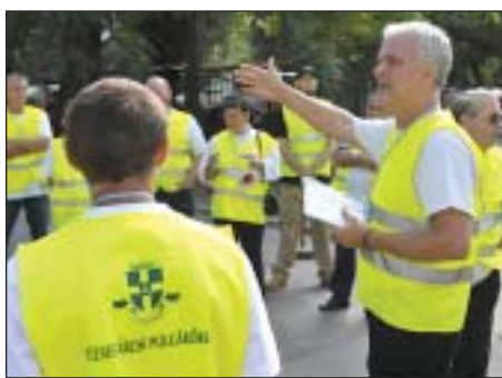
Jobb lett a polgárőrség megítélése is

A rendvédelmi szervekkel szemben a növekvő bizalom jele, hogy a kutatásban résztvevők közül – akiket ért valamilyen