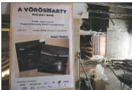
A felújítás után az intézményben 8-10 fogyatékos-sággal élő dolgozhat majd

„Azért fogadtuk nagy örömmel ezt a kezdeményezést, mert azon túl, hogy a művésznő neve komoly súlyt ad az ügynek, örülnünk, hogy a kerületben létrejön egy ilyen intézmény. A józsefvárosi és a fővárosi önkormányzat minden támogatást és lehetősé-