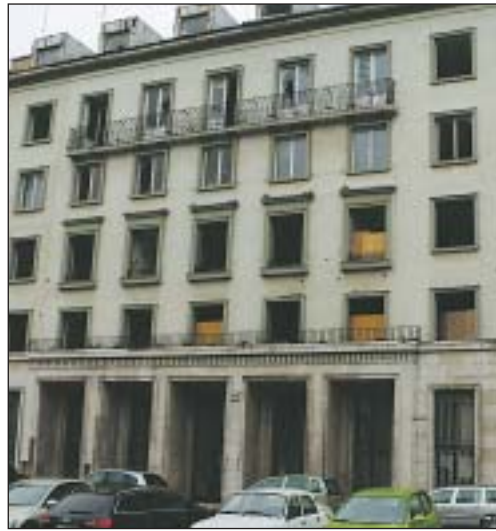
Az egykori székház drogosok és hajléktalanok tanyája lett

A tulajdonosok hatalmas adósságot és rendezetlen környezetet hagytak maguk után. Az épület már jó ideje a hajléktalanok, a drogosok és a prostituáltak tanyája, állapota – a fémtolvajoknak is köszönhetően – folyamatosan romlik. A környéken élők egyre jobban zavarja, ami az épület-