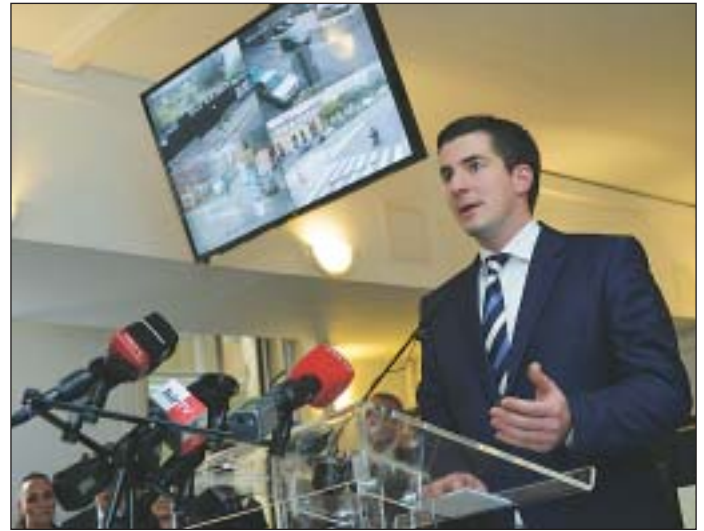
Kocsis Máté: Az elmúlt év tapasztalatai pozitívak, de van még mit tenni a közbiztonság területén

élők. Összességében pozitívak a tapasztalatok, de pontosan tudom, hogy a közbiztonság az a terület, ahol mindig vannak és lesznek is megoldandó feladatok.