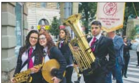
Az olasz fúvósok az utcán is zenéltek