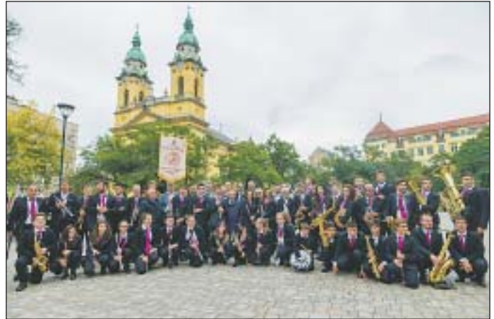
A zene szeretete indította el az iskolák közti kapcsolatot

Az olasz küldöttséget pénteken a Józsefvárosi Önkormányzat épületében látták