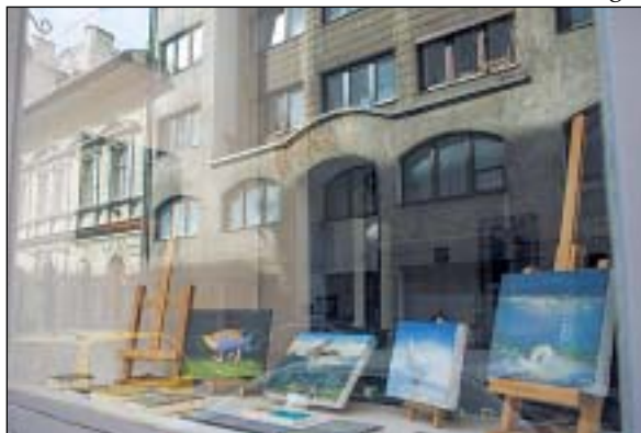
Az új kiállítóterek még több turistát vonzhatnak a kerületbe