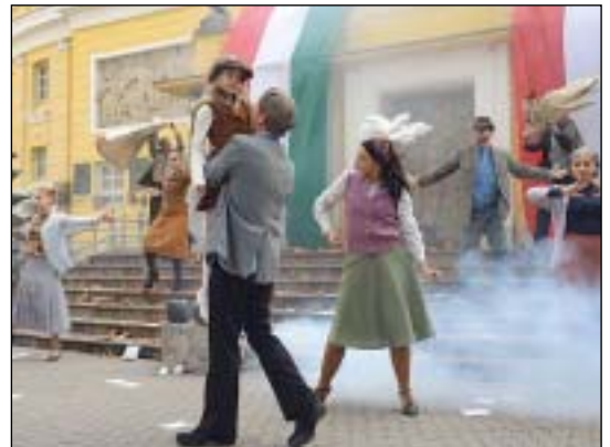
A Turay Ida Színház művészei egy magával ragadó, korhű táncjátékot adtak elő