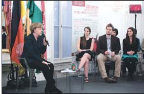
Hallgatók kérdéseire válaszolt a kancellár az Andrassy Egyetemen

Hivatalos látogatást tett Budapesten Angela Merkel. A német kancellár hétfőn délelőtt Orbán Viktorral tárgyalt az Országházban, akivel közös sajtótájékoztatót tartottak. Európa egyik legfontosabb vezetője később Áder Jánossal is találkozott, majd a Józsefvárosban található Andrassy Gyula Budapesti Német Nyelvű Egyetemre is ellátogatott, ahol átvette a szegei egyetem díszdoktori oklevelét és egyetemistákkal beszélgetett.