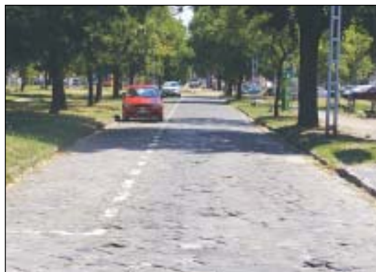
A program keretében megújul a Fiumei út szervizútja, járdaszakasza és rendezik a zöldfelületet is

Mivel az érintett területek a Fővárosi Önkormányzat tulajdonában vannak, ezért a beruházást a Józsefvárosi Önkormányzat és a Fővárosi Önkormányzat közösen bonyolítja le. Ez azt jelenti, hogy új