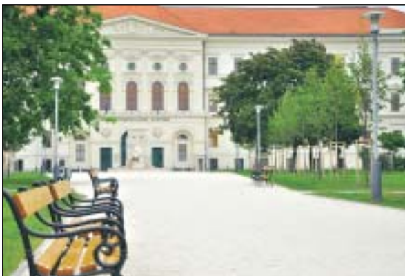
Felpozsduilt az élet a Ludovika környékén is