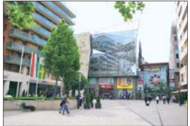
A Corvin negyed a fiatalok kedvence

Kiemelten foglalkozik a közbiztonság kérdésével is, amely témakörben többeket is megszólaltat, akik állítják, hogy nem látnak különbséget