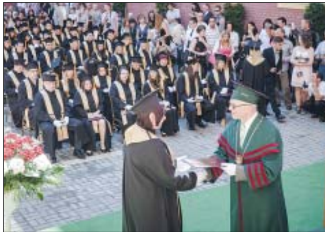
A levelező képzés munka és család mellett is elvégezhető

Az öt alapképzési szak átfogó kínálatot biztosít az üzleti tanulmányok mellett döntő hallgatók számára. A jelentkezők pénzügy és számvitel, kereskedelem és marketing, emberi erőforrások, gazdálko-