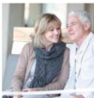
Ha túl sokat várunk, akkor lehet, hogy már késő lesz.

Szilveszterkor sokan elhatározzák, hogy egészségesebb, teljesebb életet fognak élni. Talán nem is gondolnánk, hogy hallásunk egészsége milyen óriási hatással van életünkre. Miért érdemes megfogadnunk, hogy sokkal inkább odafigyelünk hallásunk épségére?