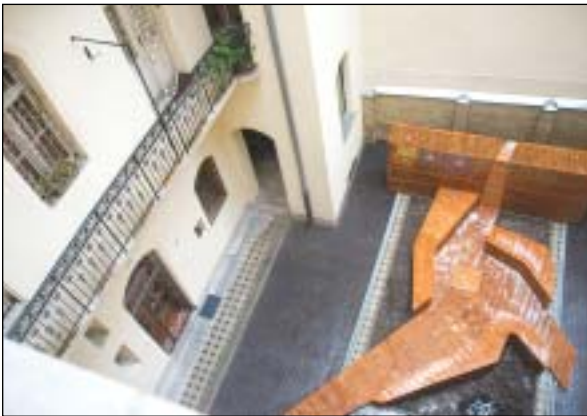
Az udvaron új közösségi teret is kialakítottak

Újabb társasház újult meg az Európa Belváros Program II. üteme keretében. A Lőrinc pap tér 3. szám alatti háznak nemcsak a kapualja, de a belső udvara is új külsőt kapott, mellyel új közösségi tér jött létre.