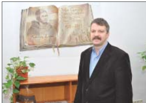
Krámer György: az új központ az egyház közösségének és a kerületieknek egy új közösségi teret is biztosít

A megújult Evangélikus Országos Központ egyházi rendezvényeknek, kulturális eseményeknek, konferenciáknak, oktatási,