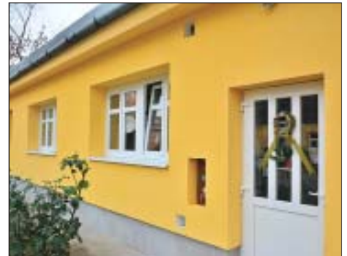
Új nyílászárókat és homlokzati szigetelést kapott az Ezüsthényő Gondozóház is

Mint Sára Botond, Józsefváros alpolgármestere lapunknak elmondta, az önkormányzat az idei esztendőben további idősklubok felújítását is tervezi, valamint a meglévő klubok mellé egy újat is szeretne kialakítani a Palotanegyedben. Sára Botond hozzátette: az önkormányzat a jövőben is keresni fogja azokat az uniós és állami pályázati lehetőségeket, amelyek segítségével folytatódhatnak az intézmények további energetikai fejlesztései.