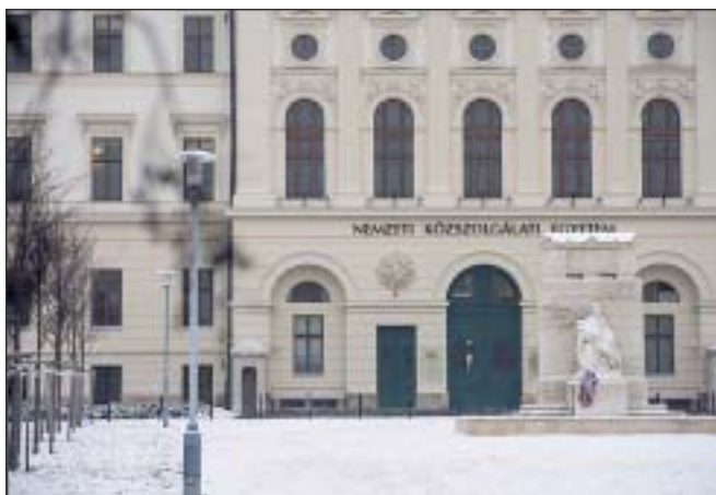
Az egyetem további fejlesztése jó hatással lesz az Orczy negyedre is