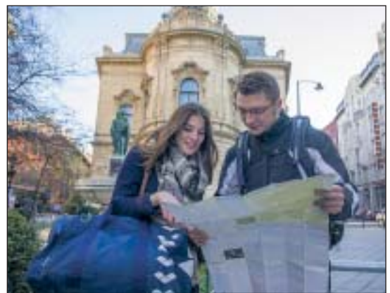
A Vogue magazin szerint kihagyhatatlan hely Józsefváros

A cikk szerint pár éve a kerület a Magyar Nemzeti Múzeumon és a Szabó Ervin Könyvtár épületén kívül nem rejtgetett látványosságokat. Mára azonban – Józsefváros újjáépülésének köszönhetően – kötelezően megnézendő hely lett Budapesten. A Vogue nemcsak a VIII. kerület megújult köztereit és épületeit, hanem pezsgő kulturális életét is méltatja, továbbá megjegyzi, hogy mindenképp érdemes ellátogatni ide