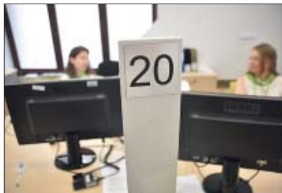
Január elsejétől számos okmányt ingyen állítanak ki

okmányok pótlásának eljárása is ingyenes január elsejétől az illetéktörvény módosítása révén. Idén már nem kell leróni