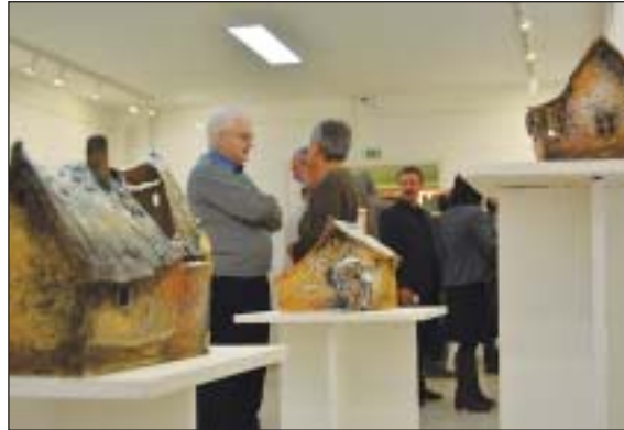
Az alkotások csendes, téli tájra repítenek bennünket