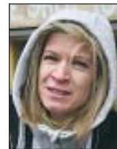
Panna, 24 éves, biomérnök

vállaljon valaki gyermeket, mert pénzt kap érte. Az építőipart mindenestre fel fogja lendíteni, hiszen a legnagyobb támogatást az újépítésű otthonokra adják.