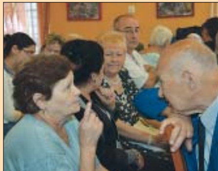
Az új idősklub a Baross utcában nyílik meg

Kerületünkben a Józsefvárosi Szociális Szolgáltató és Gyermekjóléti Központ Nappali ellátás szakmai egysége biztosítja – kötelező önkormányzati feladatként – az idősek nappali ellátását. Jelenleg öt idősklub működik a kerületben, azonban Belső-Józsefvárosban eddig nem volt lehetőség ilyen szolgáltatás igénybevételére. Mivel a Palotanegyedben 2066